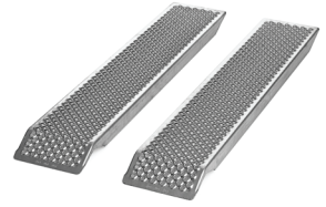
LADERAMPEN GERADE 505 69 90-45