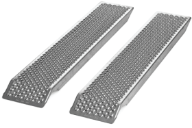
LADERAMPEN GERADE 505 69 90-40