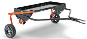
PLATTFORM 586 63 72-01