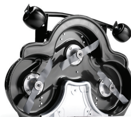
MÄHWERK 967 18 85-01