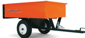
ANHÄNGER 275 501 00 82-01