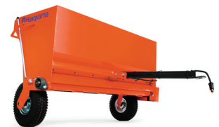
STREUWAGEN PROFİ 953 52 49-01