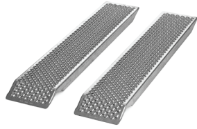
LADERAMPEN GERADE 505 69 90-42