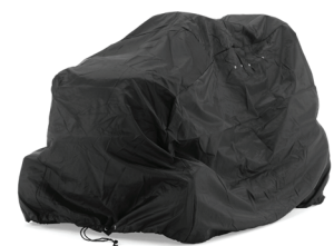
ABDECKPLANE 505 63 08-70