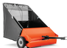
RASENKEHRMASCHINE 582 71 99-01