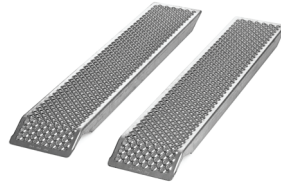
LADERAMPEN GERADE 505 69 90-44