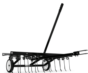
ENTMOOSER 586 63 66-01