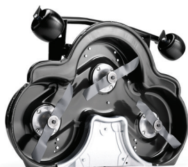
MÄHWERK 967 15 24-01