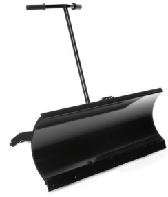
SCHNEERÄUMSCHILD 966 41 59-01