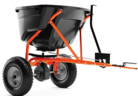
STREUWAGEN 75 967 02 72-01