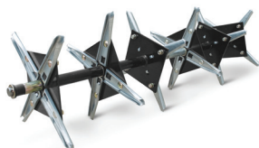
STERN-AERIFIZIERWELLE 588 21 27-01