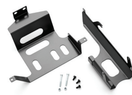
SCHUTZPLATTEN-KIT 544 06 93-04