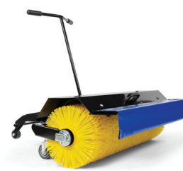
KEHRBÜRSTE 587 02 46-01