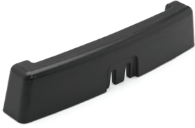
HECKGEWICHT 953 53 49-01