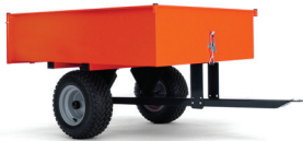
ANHÄNGER PROFİ 953 51 17-02