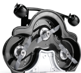
MÄHWERK 967 15 26-01