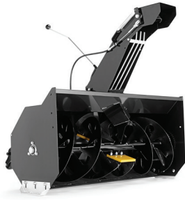
SCHNEEFRÄSE 967 27 67-01