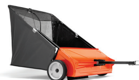
RASENKEHRMASCHINE 586 63 65-01