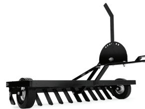
SCHOTTERHARKE 953 51 24-01